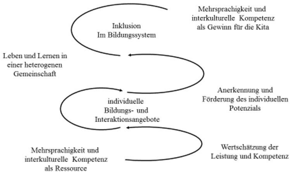
Abb. 3: Positive soziale Spirale in der Argumentation inklusiver Bildungsverläufe

und Förderung individueller Potenziale und der Gestaltung individueller Bildungs- und Interaktionsangebote innerhalb einer heterogenen Gemeinschaft. Wenn dies als handlungsleitende Perspektive für die frühpädagogische Praxis genutzt wird, wird deutlich, dass damit ein Gewinn für alle Kinder, unabhängig von Status, Geschlecht, Herkunft, Alter und Fähigkeiten verbunden ist (siehe Abb.3).